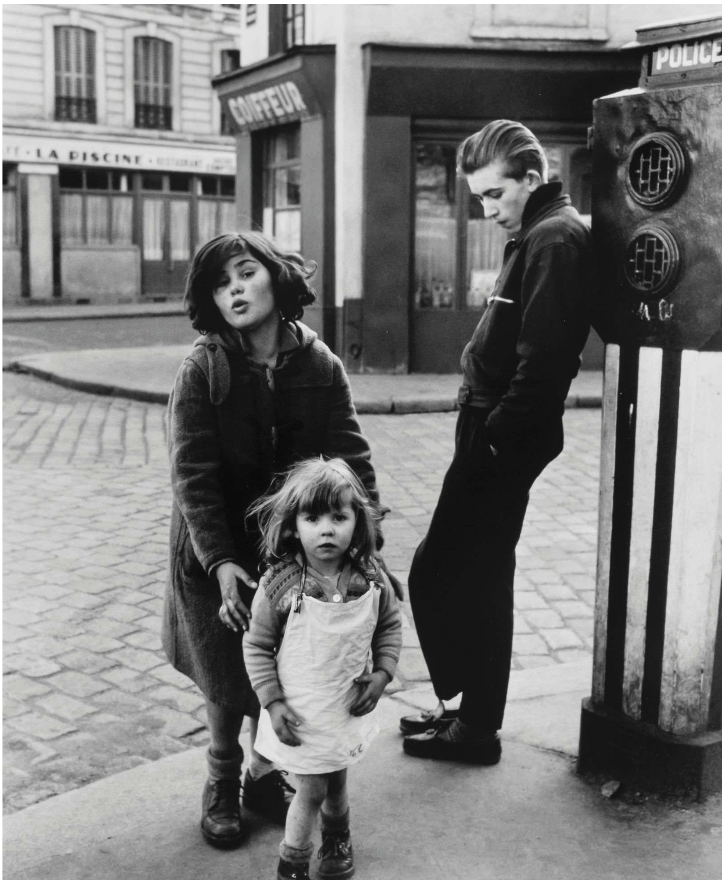
Foto de Robert Doisneau (1912-1994) em Paris.

O primeiro fotógrafo pelo qual criei admiração foi o parisiense ROBERT DOISNEAU . A precisão em captar cenas do cotidiano, em uma fração de segundo, aliadas à narrativa e a uma composição estética impecável é surpreendente. Visionário, divide com o mundo seu olhar poético sobre o dia a dia.