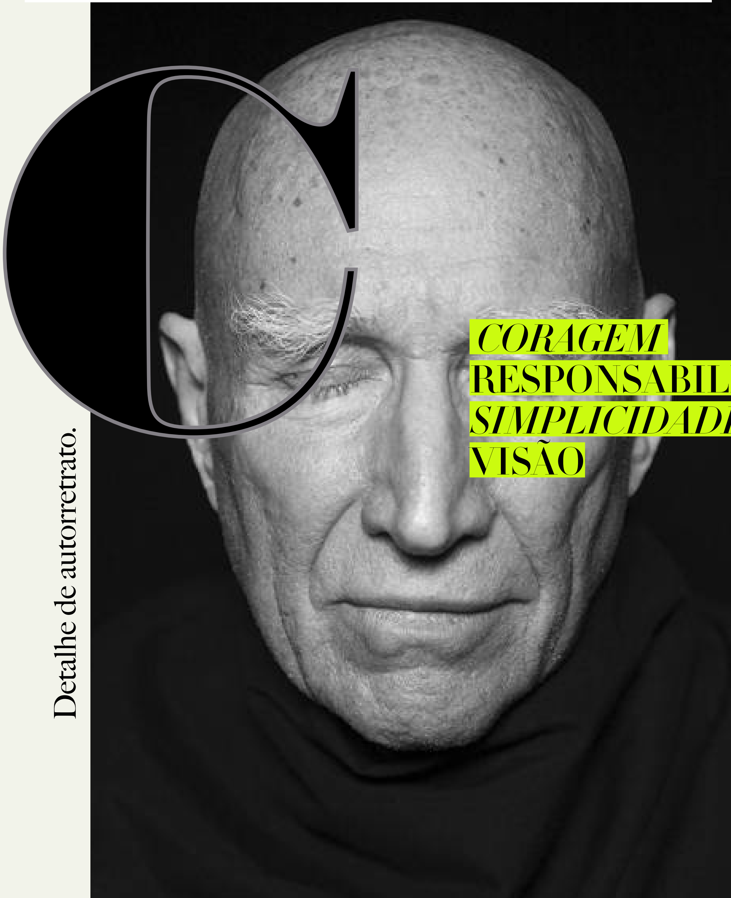
Detalhe de autorretrato.

CORAGEM RESPONSABILIDADE SIMPLICIDADE VISÃO