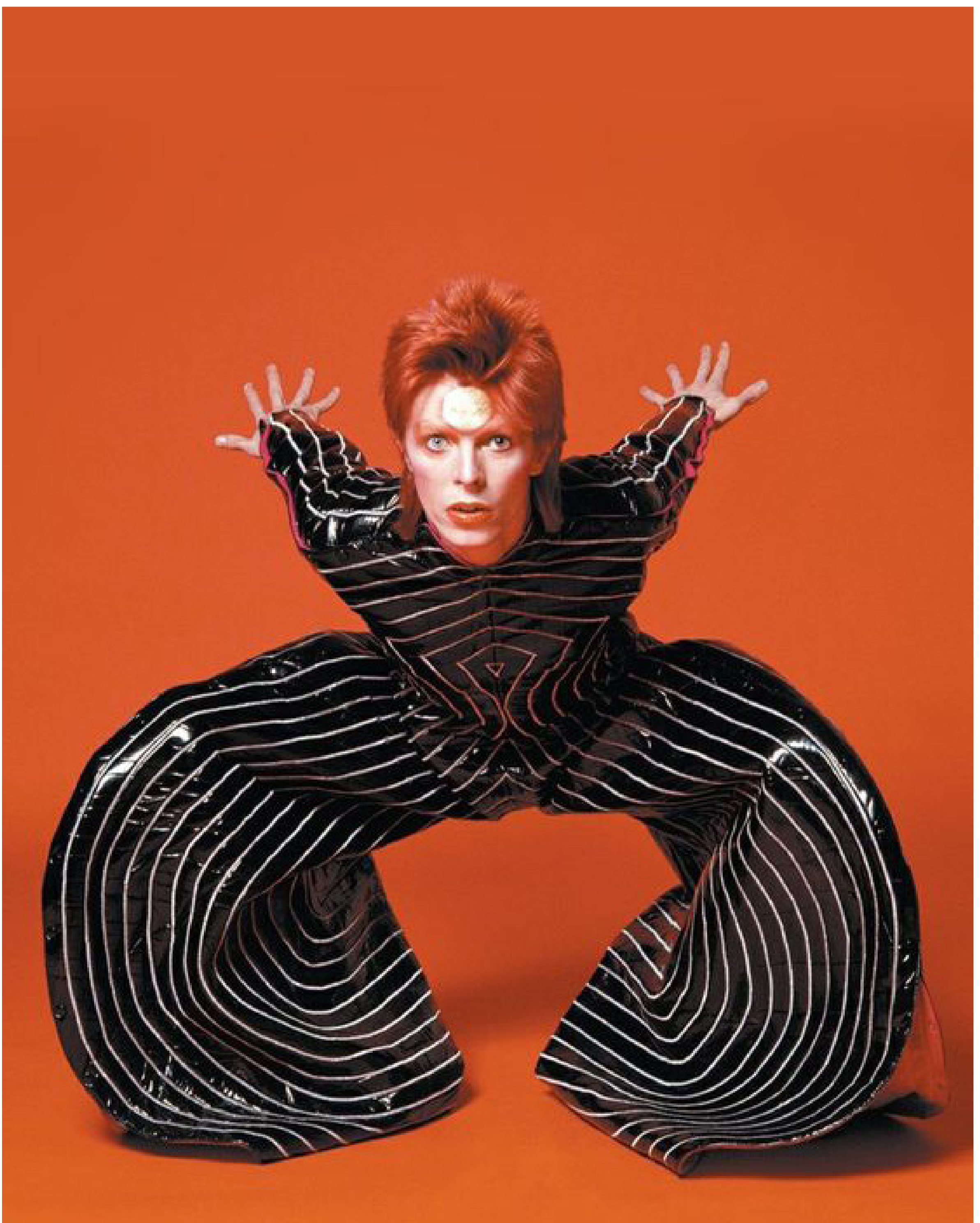
Bowie vestindo Kansai Yamamoto | 1973

Múltiplo, o britânico, nascido em (1947-2016) DAVID BOWIE , revolucionário e à frente do seu tempo, possibilitou que muitos artistas pudessem se inventar e se expressar por meio do legado transgressor, imagético, sonoro, libertador deixado por ele. O mundo é dos extraordinários.