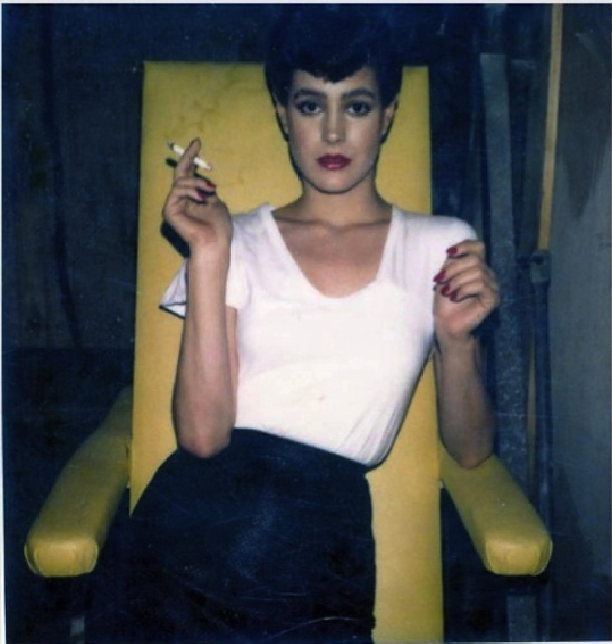
Polaroid tirada por Sean Young durante as gravações.

BLADE RUNNER tem uma estética absurda! A construção da trama entre os personagens e o diálogo entre o filme e o nosso presente é superinteligente. No filme de Ridley Scott, de 1982, os replicantes tinham sentimentos humanos enquanto hoje temos a Sophia (uma robô com inteligência artificial baseada em anatomia humana e aprendizado por experiência). Hoje, os algoritmos interagem com nossas memórias e desejos por todos os lados, como na internet.