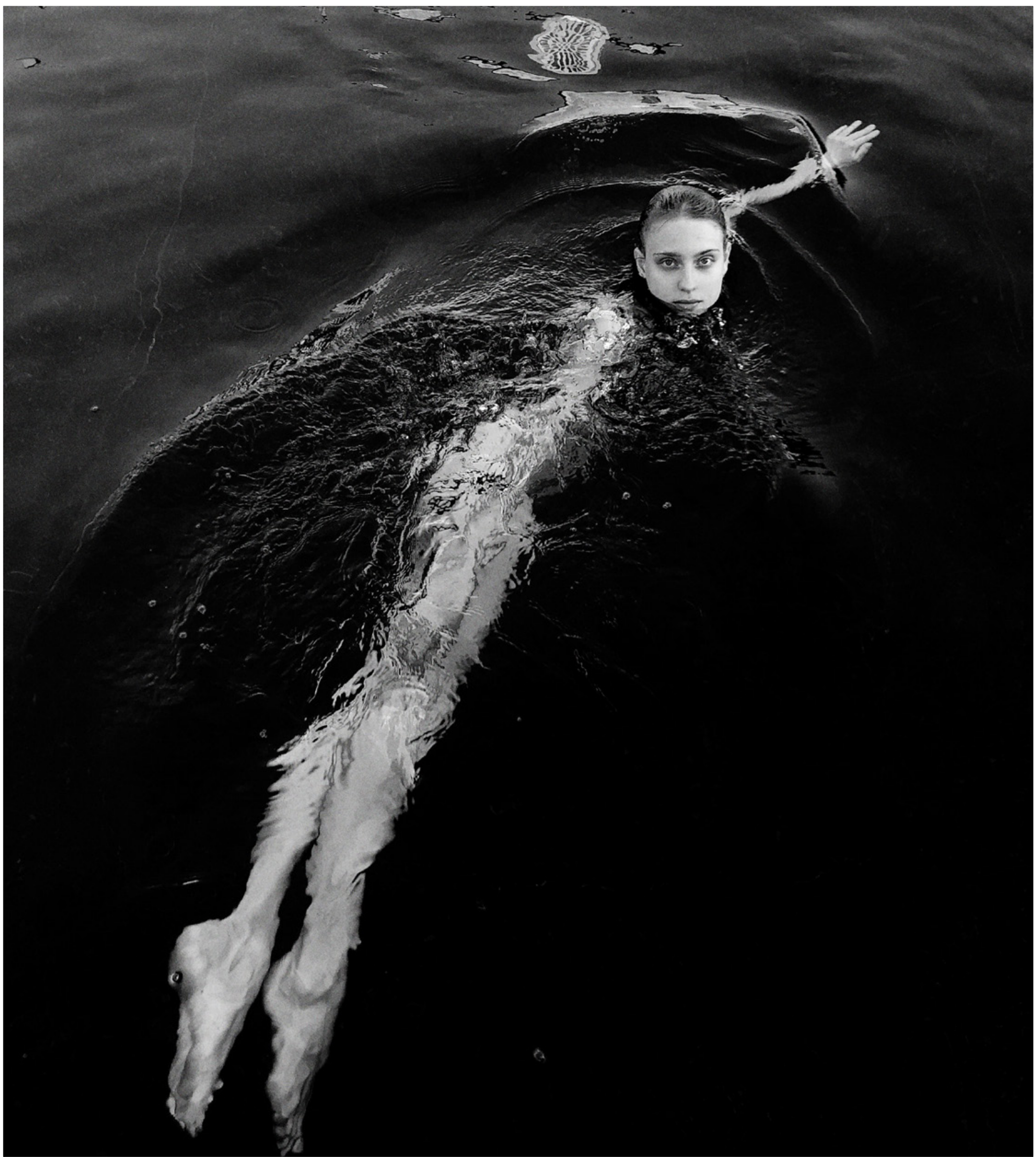
Imagem que criei com smartphone | 2019

Não importa o equipamento, com uma boa ideia é possível falar com clareza e mostrar sua arte. A foto acima foi feita com a câmera do meu smart phone . Estudo, pesquisa e dedicação são também chaves para alcançar bons resultados, acredite em você, experimente.