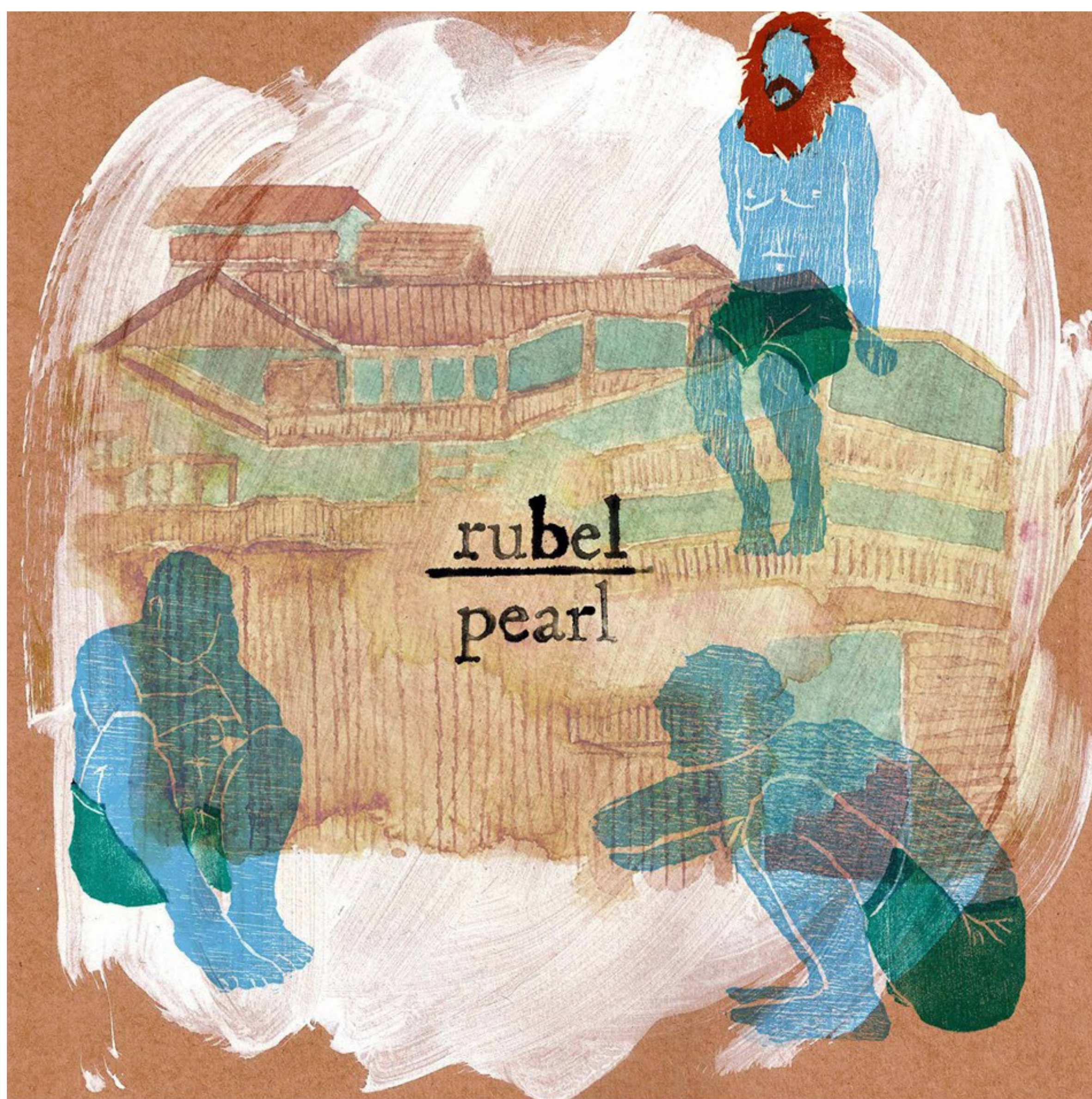
Capa do álbum Pearl | 2013

Conheci o cantor RUBEL na série “Onde Nascem os Fortes” (Globo). Ele revisita diversos valores da música brasileira e a leva para novos caminhos. Boa trilha para acalmar o coração nos dias de quarentena.